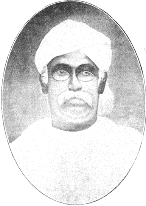
दीनानाथ विष्णु माडगांवकर